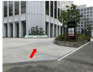
5. 左手ビルにTKP看板が見えてきます 正面玄関よりご入館ください