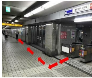
1. 御堂筋線北改札出口を出まして、 右方向へお進みください