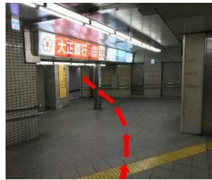
2. 8番出口の看板がございます、 矢印の方向にお進みください