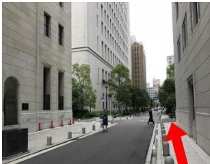
4. そのまま真っすぐにお進みください