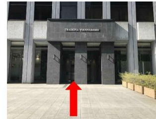
6. 写真がガーデンシティ大阪淀屋橋 の正面玄関になります

大阪メトロ御堂筋線 淀屋橋駅 8番 徒歩5分、堺筋線 北浜駅 2番出口 徒歩5分 京阪本線 淀屋橋駅 19番出口 徒歩5分